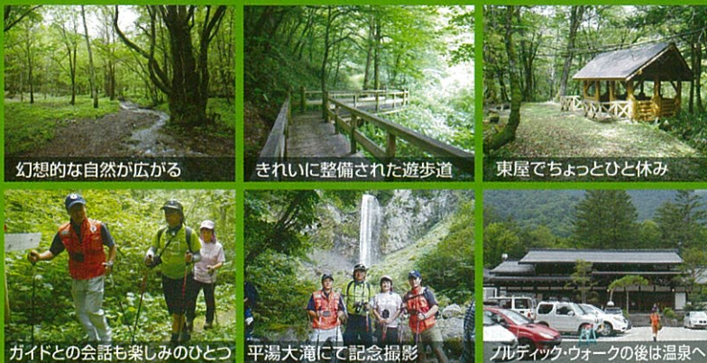
幻想的な自然が広がる